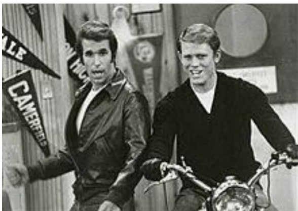
moderne d' Happy Days )